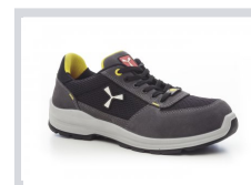
S0104 GRIS ACIER/NOIR