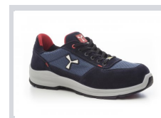
S0300 BLEU MARINE/PORT DE MER