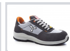
S1003 GRIS ACIER/GRIS CLAIR