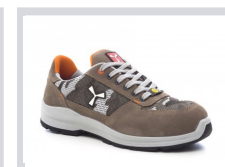
S0200 KAKI/MIMÉTIQUE GRIS